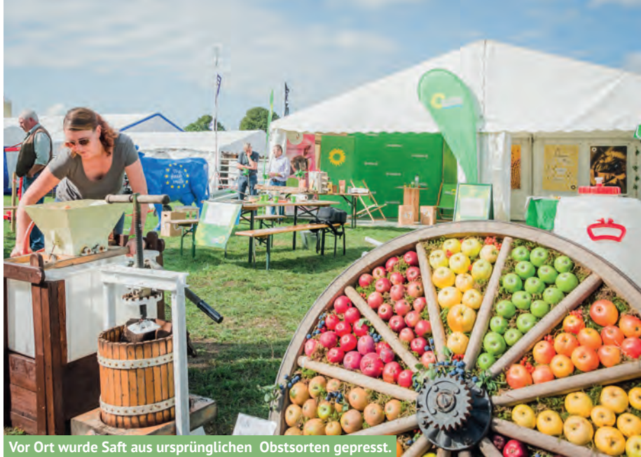
Vor Ort wurde Saft aus ursprünglichen Obstsorten gepresst.